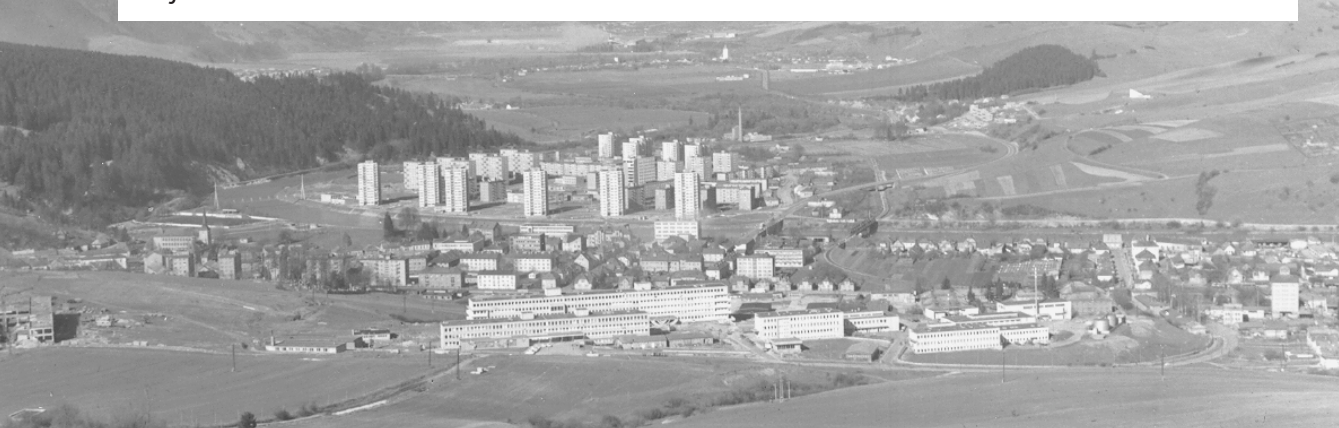
Pohľad na nemocnicu (1975).

V tomto čísle novín sa vrátíme ďalej do minulosti. V kronike z roku 1975 sa nachádza zápis, ktorý hovorí o vzbure oravských richtárov, od ktorej vtedy uplynulo 200 rokov. Je neuveriteľné, ale zároveň nepochopiteľné aj smutné, ako málo toho vieme o našej minulosti, o minulosti nášho mesta. Mnohí denne prechádzame po dnešnom Hviezdoslavovom námestí, hmlisto sa pamätáme na udalosti, ktoré sa tu odohrali napríklad počas nežnej revolúcie v roku 1989. Ale koľkí z nás tušia, čo sa na námestí odohrávalo pred takmer 250 rokmi? Že dnešná Oravská galéria bola župným domom s väznicou? Že sa na námestí vykonávali fyzické tresty? Že naše dnešné problémy by sa vtedajším ľuďom, ktorým išlo o prežitie, zrejme zdali malicherné?